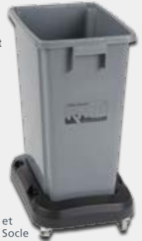
JH485 et JH483 Socle