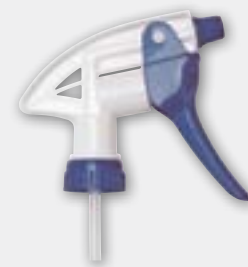
Grand pulvérisateur multi-usage 9", tube plongeur bleu/blanc No modèle NJ167