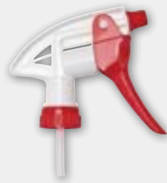
Pulvérisateur multi-usage 8", tube plongeur rouge/blanc No modèle NJ166